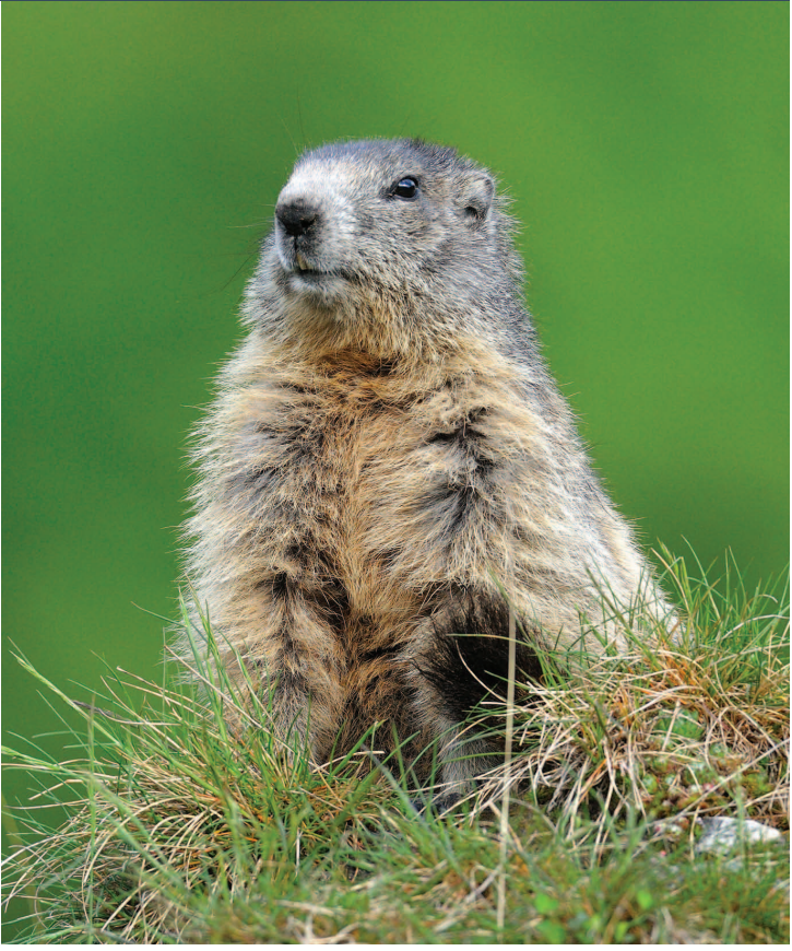
Roland Clerc www.faune-valais.ch